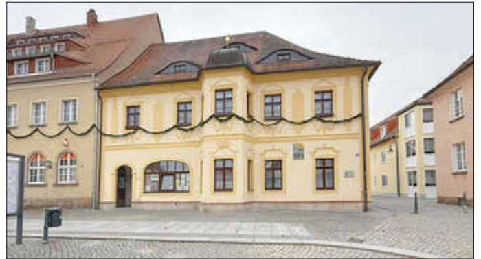
Blick auf das Gebäude Markt 24

Nach Abschluss der Arbeiten erstrahlt die Fassade an einem der ältesten Gebäude in Neustadt in Sachsen nun wieder im frischen Farbton.