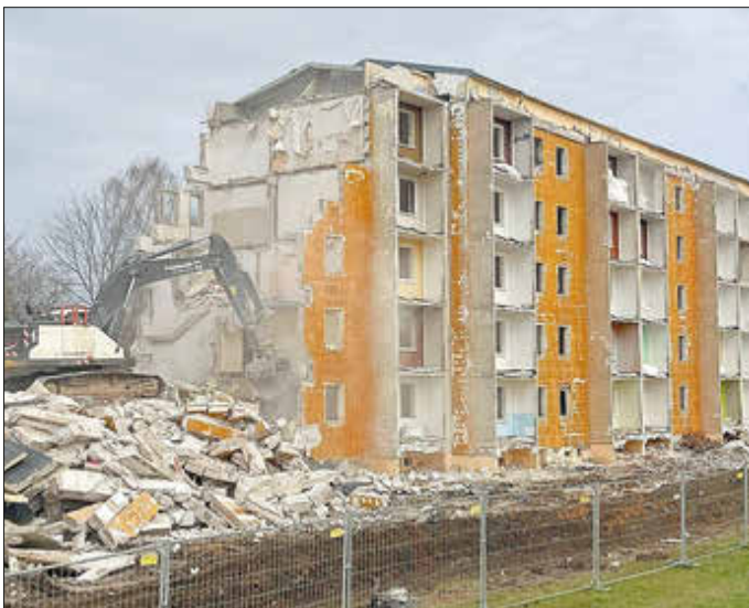
Rückbau des Wohnblocks am 14. November 2025

Da sich das Grundstück im Fördergebiet „Neustadt West“ befindet, werden die Rückbaukosten in wesentlichen Teilen aus dem Städtebauförderprogramm „Wachstum und nachhaltige Erneuerung“ (WEP) im Programmteil Rückbau Wohngebäude förder-technisch kofinanziert.