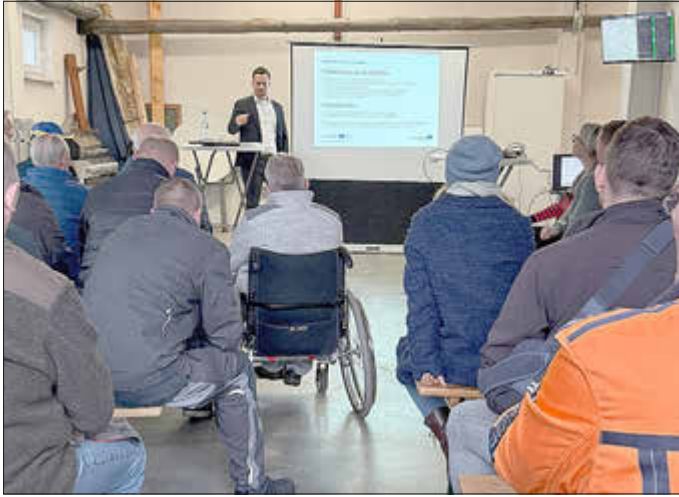
Einwohnerversammlung im Ortsteil Rugiswalde

ckenbaches, der Ausbau des Schwarzbachweges im Ortsteil Krumhermsdorf im ersten Bauabschnitt, die Decklagenerneuerung auf der Bischofswerdaer Straße und die Schadensbeseitigung des „Starkregenereignisses 2021“ im Ortsteil Rugiswalde. Zum Schluss bekamen die Einwohnerinnen und Einwohner Gelegenheit, Fragen zu stellen sowie Hinweise zu geben. Diese konnten durch den Bürgermeister überwiegend beantwortet werden. Ein Dankeschön geht an alle Anwesenden für ihr Kommen.